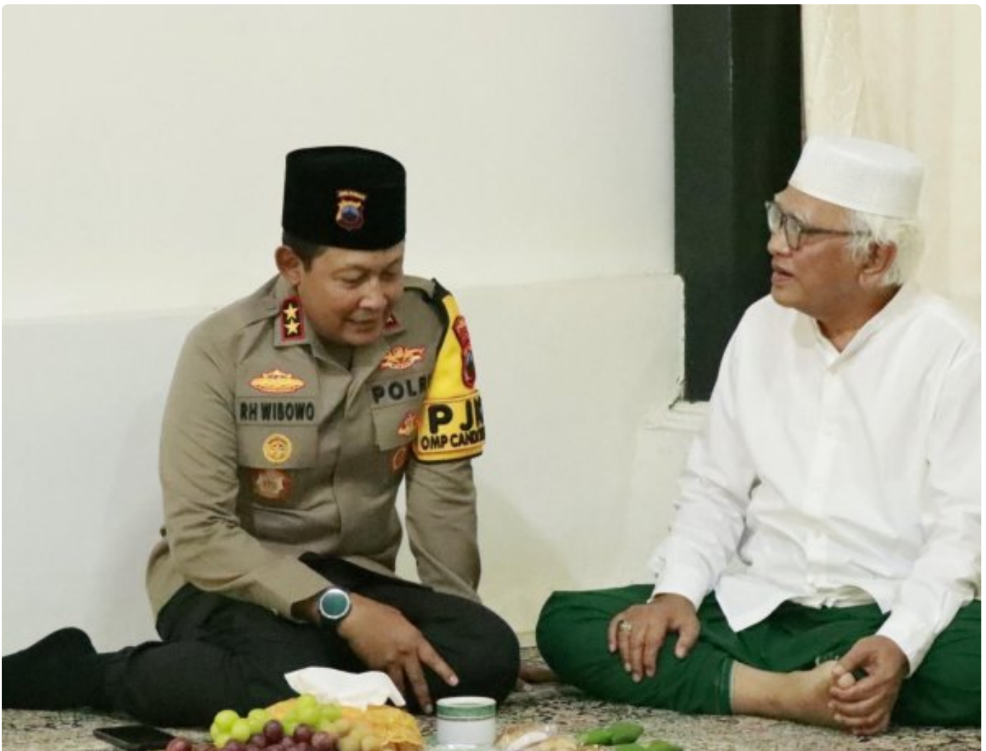
Foto: Kapolda Jawa Tengah, Irjen Pol Ribut Hari Wibowo, melakukan kunjungan silaturahmi ke sejumlah tokoh agama terkemuka di Kabupaten Rembang pada kesempatan menjelang Pilkada 2024. Senin (21/10/2024).

REMBANG - Dalam suasana hangat dan penuh kekeluargaan, Kapolda Jawa